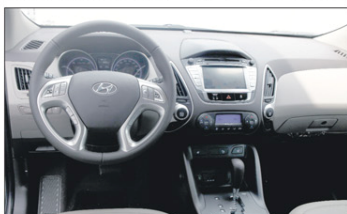
Unutrašnjost je izdašna i luksuzna