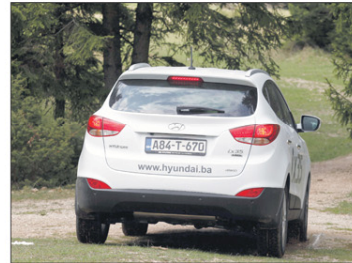
Zadnji kraj kazuje o snazi