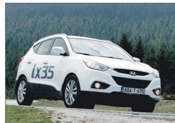
Robusni prednji dio nasljednika Tucsona

Zatim, Smart key sistem omogućava ulazak u vozilo i njegovo pokretanje bez korištenja ključa, koji bez problema može ostati u vlasnikovom džepu.